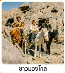
ชามองโกล