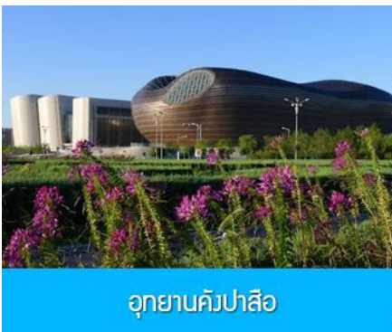
อุทยานคังปาลือ