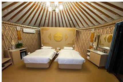
ห้องพักสไตล์มอว์โกเลีย