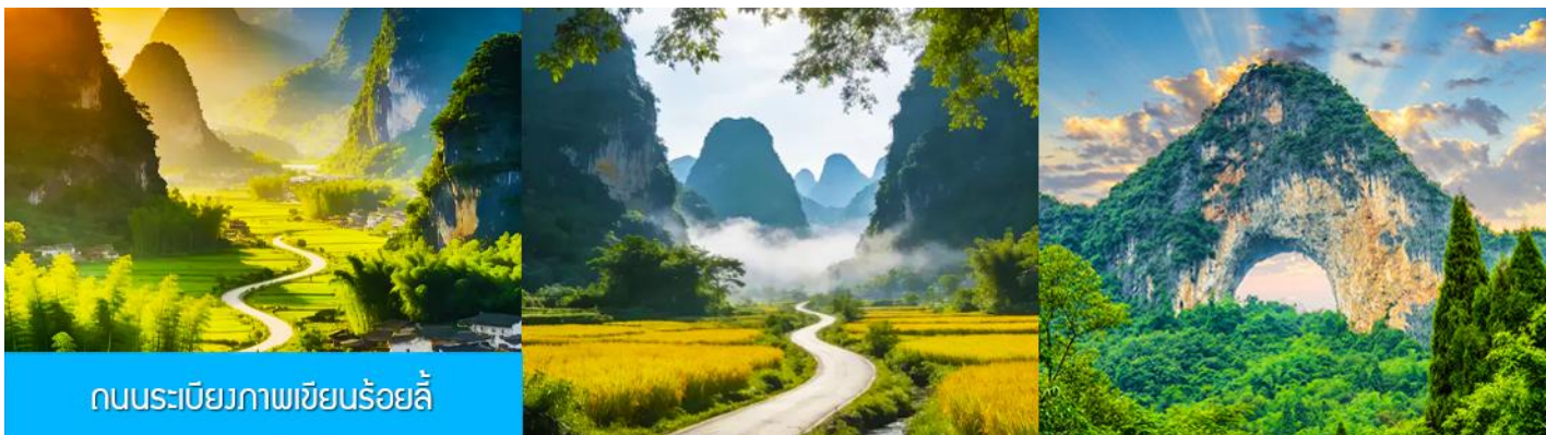
ถนนระเบียบภาพเขียนร้อยลี้

จากนั้นนำท่านเดินทางสู่ เมืองหยางชัว 阳朔 (ระยะทาง 80 กม. ใช้เวลาเดินทาง 1 ชั่วโมง)