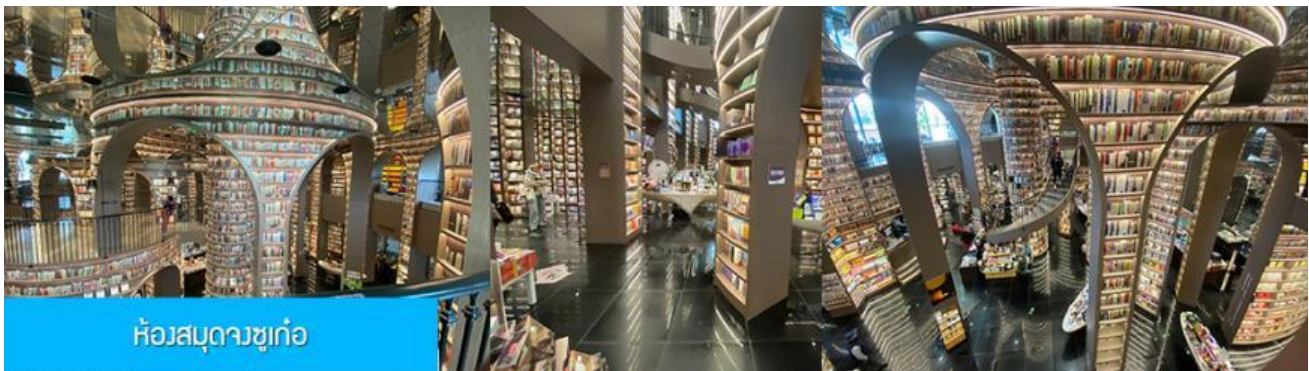
ห้องสมุดจซูก่อ

หลังอาหารนำท่านชม สะพานหนานเจียว 南桥 สะพานโบราณक्रमแม่น้ำตู่เจียงเยียนขึ้นชื่อที่ได้กลายเป็นแหล่งท่องเที่ยวสำคัญและจุดเช็คอินสำหรับนักท่องเที่ยว ในช่วงค่ำที่นี่จะประดับประดาด้วยแสงสี บริเวณริมน้ำจะถูกประดับด้วยแสงไฟสีฟ้าที่ทอดยาวไปตามแนวแม่น้ำ ชาวบ้านตั้งชื่อว่าเป็น น้ำตาสีฟ้า 蓝色眼泪 พักที่ โรงแรม CENTER INTER HOTEL ระดับ 4 ดาวท้องถิ่นหรือเทียบเท่าในเมืองตู่เจียงเยียน