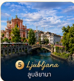
5 Ljubljana ลูบลียานา