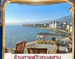
ร้านอาหารวิวทะเลสาบ BAN SHAN YUE (รวมค่าเช่า ไม่รวมเครื่องดื่ม และค่าเช่าเสื้อผ้ารูป)