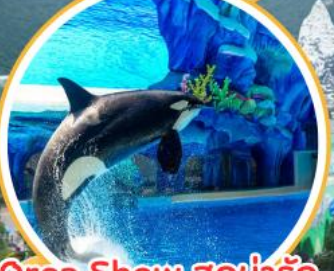
Orca Show สุดน่ารัก