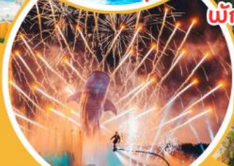
อลังการพลุ 360 องศา