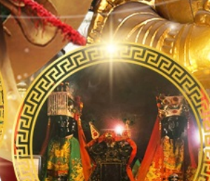
วัดบ้านโหมง