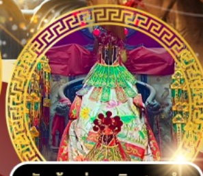
วัดเจ้าแม่กวนอิมสองอำ