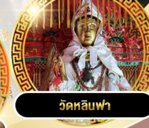
วัดหลิวฟา