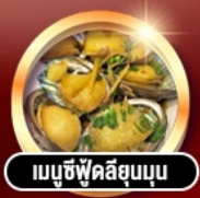
เมนูซีฟู้ดลิ้นขุน