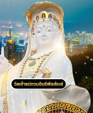
วัดเจ้าแม่กวนอิมรัฟาสีบย