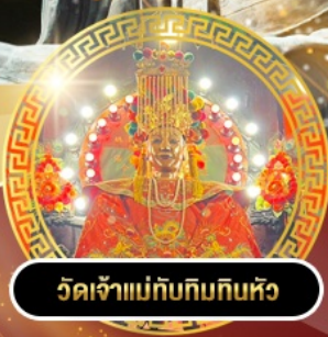
วัดเจ้าแม่กิมกิมทิว