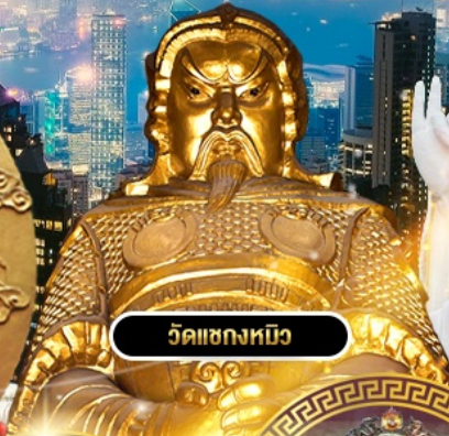
วัดเข่งหนิว