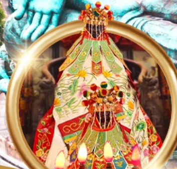
ยืมเงินเจ้าแม่กวนอิมสองห้า