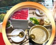
บุฟเฟ่ต์ชาบู เสิร์ฟไม่อั้น!!