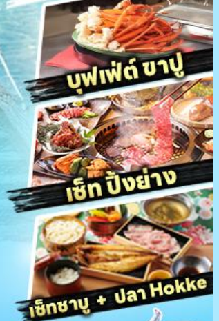
บุฟเฟต์ ซาซุ