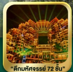
"ตึกมหัศจรรย์ 72 ชั้น"

รวมรถไฟความเร็วสูง 1 ขบวน + รถบัสขนกระเป๋าแล้ว