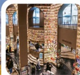
“ห้างสรรพสินค้าจงซูเก๋อ”