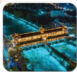
“สะพานหนานเจียว”