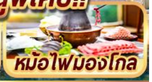
หม้อไฟมองโกเลีย