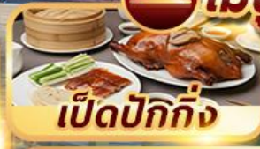
เปิดปักกิ่ง