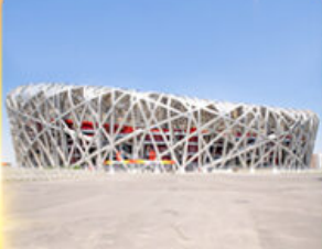
สนามกีฬาโอลิมปิก