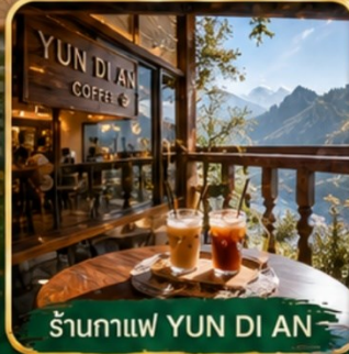
ร้านกาแฟ YUN DI AN