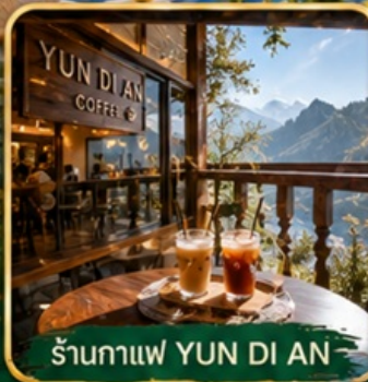
ร้านกาแฟ YUN DI AN