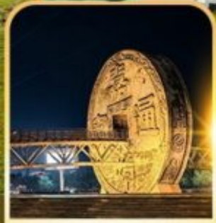
จัตุรัสเหรียญโบราณ