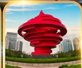
จตุรัสหาลี่