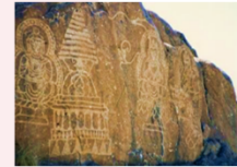
เมืองชิลาส

** พักที่ Shangrila Chilas Hotel หรือเทียบเท่า **