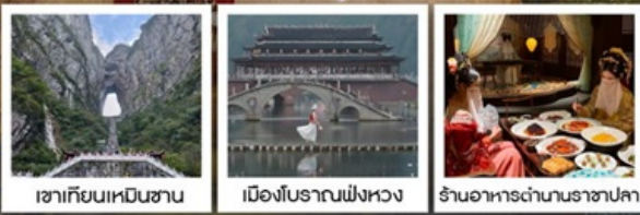
เขาคิยงเหมินซาน

พิเศษ!!...รอบค่ำเช้าชุดพื้นเมืองที่ฟ่งหวง • รอบค่ำช่างถ่ายรูป น้ำตกฟูหรง