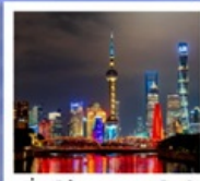
เชียงใหม่ คคลาศลิก ไทท์