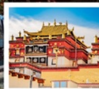
วัดชงจันหลิง