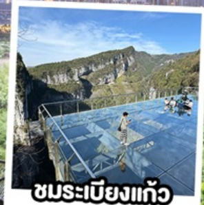
ชมระเบียบแก้ว