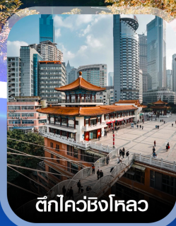
ตึกไอซ์ชิ่งไหลว