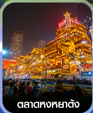
ตลาดหงหย่าตัง