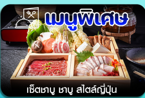
เชิซเตาซูชิ 4 ชิ้น

โอซาก้า-เกียวโต-ชิราคาวะโกะ-ทอยาม่า-ปราสาททอยาม่า-วัดนินเซนจิ-ชมงานประดับไฟ- ช้อปปิ้งชินไซซาชิ