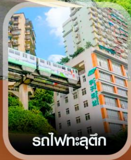
รถไฟฟ้าตุ๊ก