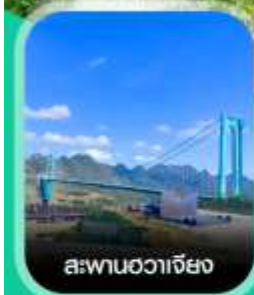
สะพานฮวาเจียง