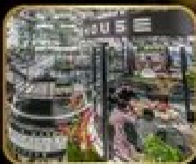
ภัตตาคารชื่อดัง WAREHOUSE NO.3