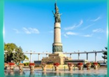
อนุสาวรีย์นิ่มพ