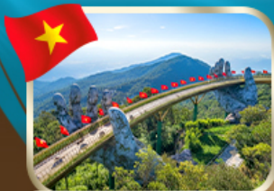
เที่ยวสะพานบ็อกงค้ำ บานาฮิลล์