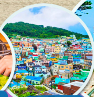
หมู่บ้านคัมซอน