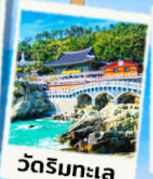
วัดริมทะเล