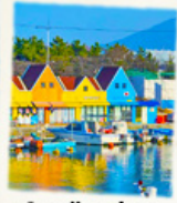
ท่าเรือสีสัน