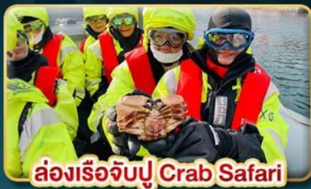
ล่องเรือจับปู Crab Safari

เยือนเมืองหลวงแห่งแสงเหนือ สัมผัสความสวยงามของนอร์เวย์ที่แท้จริง