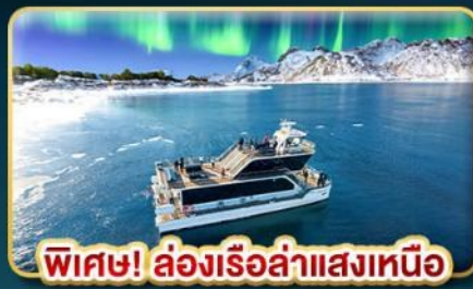
พิเศษ! ล่องเรือลำแสงเหนือ