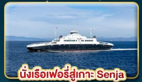
นั่งเรือเฟอร์รี่สู่เกาะ Senja