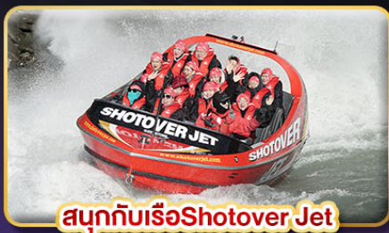
สนุกกับเรือ Shotover Jet