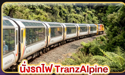
นั่งรถไฟ TranzAlpine