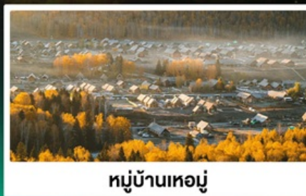
หมู่บ้านทอมู่