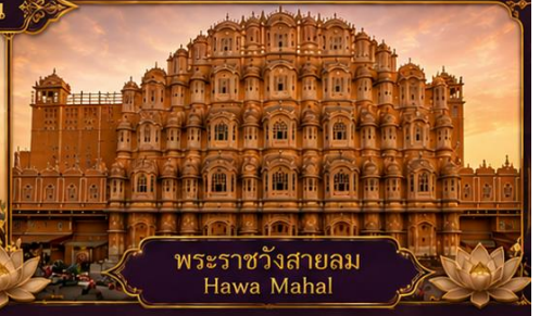
พระราชวังสายลม Hawa Mahal