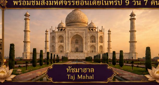
ทัชมาฮาล Taj Mahal