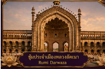
ซุ้มประจำเมืองหลวงลัคเนา Rumi Darwaza

พร้อมชมสิ่งมหัศจรรย์อินเดียในทริป 9 วัน 7 คืน