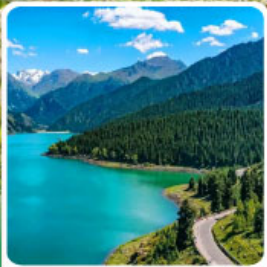
อุทยานเทียนซาน เทียนฉือ