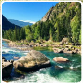
อุทยานเคอเคอทัวไฮ