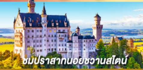
ชมปราสาทออยชวานสไตน์