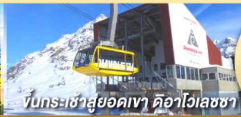
ขึ้นกระเช้าสู่ออดเขา ดือาไวเลซซา