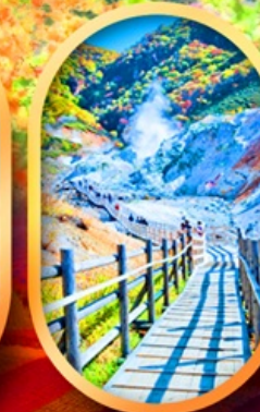
หุบเขานรกจิดอกดาบิ