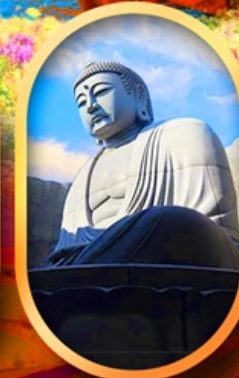
เบนเงาแห่งพระพุทธรเจ้า