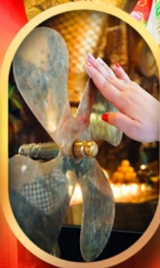
หมอนกั้งหันแซง