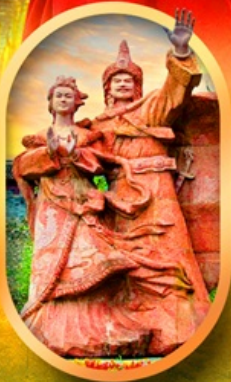
เมืองโบราณชางพาน