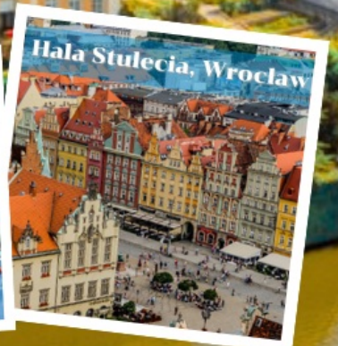
Hala Stulecia, Wroclaw