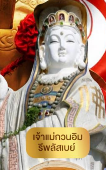
เจ้าแม่กวนอิม ริฟลิสเบย์