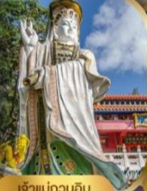
เจ้าแม่กวนอิม ริฟลิสเบย์