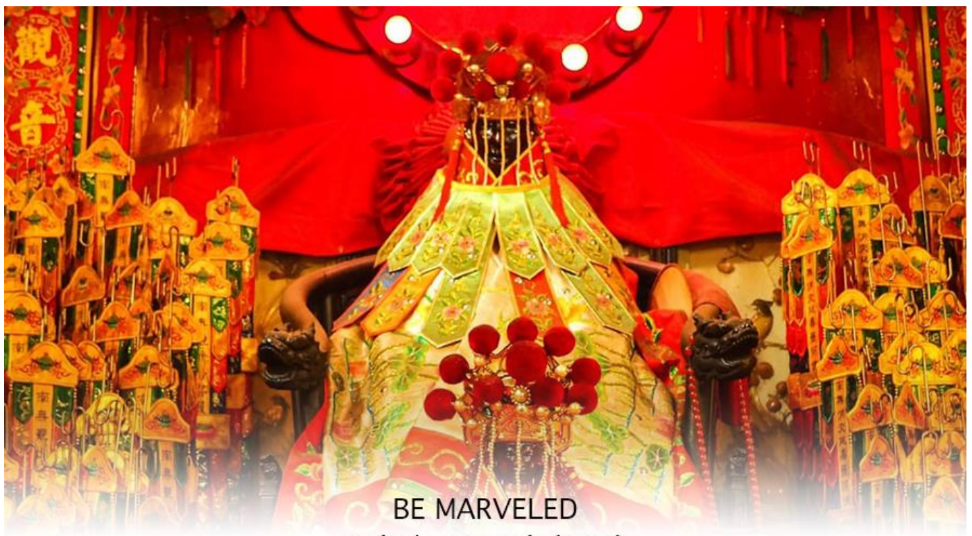
BE MARVELED วัดเจ้าแม่กวนอิมสองอำ (ฮิมฮิน)

หลังจากนั้น นำทุกท่านเดินทางไปยัง (เจ้าแม่กวนอิม วัดสองอำ (HUNG HOM KWUN YUM TEMPLE) เป็นหนึ่งในวัดที่เก่าแก่ที่สุดของฮ่องกง และชาวฮ่องกงเลื่อมใสศรัทธามาก สร้างขึ้นในปี ค.ศ.1873 ในสมัยช่วงสงครามโลกครั้งที่ 2 มีการปล่อยระเบิดลงบริเวณใกล้กับวัดแห่งนี้หลายต่อหลายครั้ง ทำให้มีผู้บาดเจ็บและล้มตายมากมาย แต่ชาวบ้านที่หนีเข้าไปหลบภัยในวัดนี้ก็กลับปลอดภัยอย่างปาฏิหาริย์ และตัววัดก็ไม่ได้ได้รับความเสียหายจากเหตุการณ์ทิ้งระเบิดที่น่าอัศจรรย์ ตามความเชื่อของคนจีนในฮ่องกง-มาเก๊า จะมี "วันเปิดทรัพย์" หรือ "พิธียืมเงิน เจ้าแม่กวนอิมฮ่องกง" เป็นวันที่จะมาขอพรและยืมเงินเจ้าแม่กวนอิมซึ่งนับจากหลังวันตรุษจีน ไป 26 วัน จะเป็นวันเปิดทรัพย์ที่จัดขึ้นในทุกๆปี พิธีนี้จะมีเพียงครั้งปีละครั้งเท่านั้น เป็นวันสำคัญอีกวันที่คนหลังไหลมาไหว้ขอพรอย่างไม่ขาดสาย