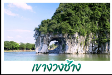
ฝางวงช้าง