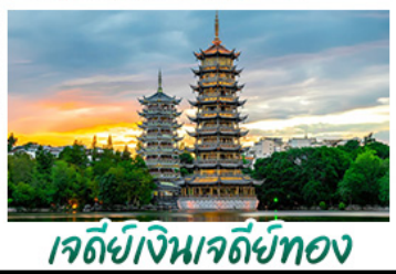
เจดีย์จินเจดีย์ทอง