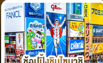
ซ้อปั้งชินโซบาชิ และโดตงโมริ