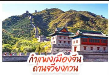
กำแพงเมืองจีน ถิ่นจิวยงกวน