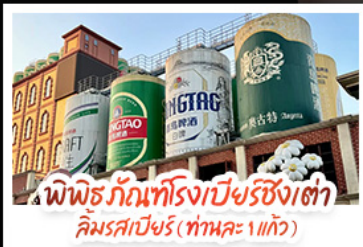
พิพิธภัณฑ์โรงเบียร์ชิงเต่า ลิ้มรสเบียร์ (ทำนคะ 1 แก้ว)