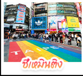
ซีเหมินดิง