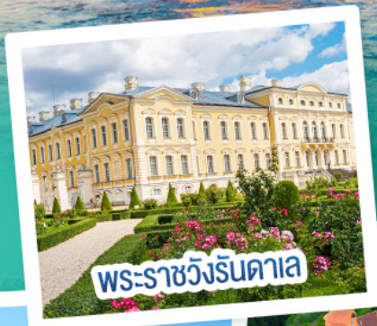
พระราชวังรินดาเล