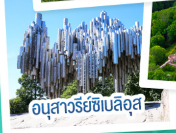
อนุสาวรีย์เซเบิลูส