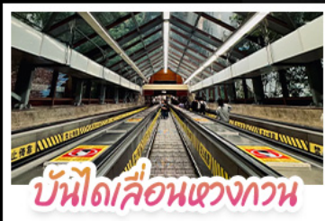
บันไดเลื่อนแขวงทวน