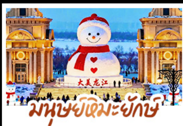
มนุษย์หิมะยักษ์