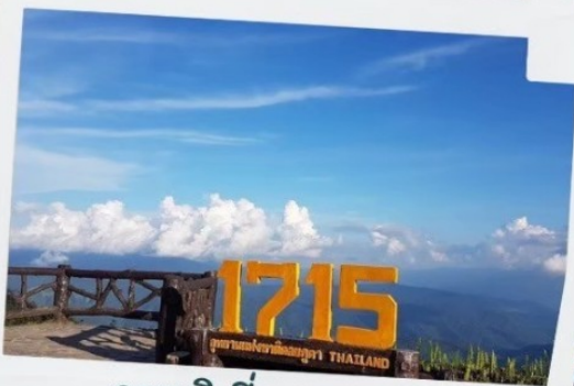
จุดชมวิวที่ความสูง 1715