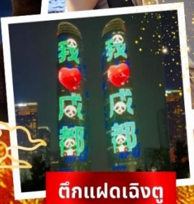
ตึกแฝดเจียงตู