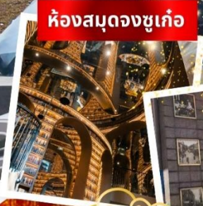
ห้องสมุดจงชู่เก้อ