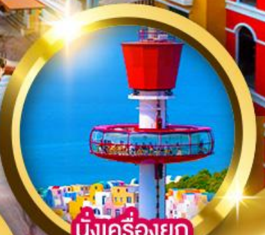
นั่งเครื่องยก Eagle Eye